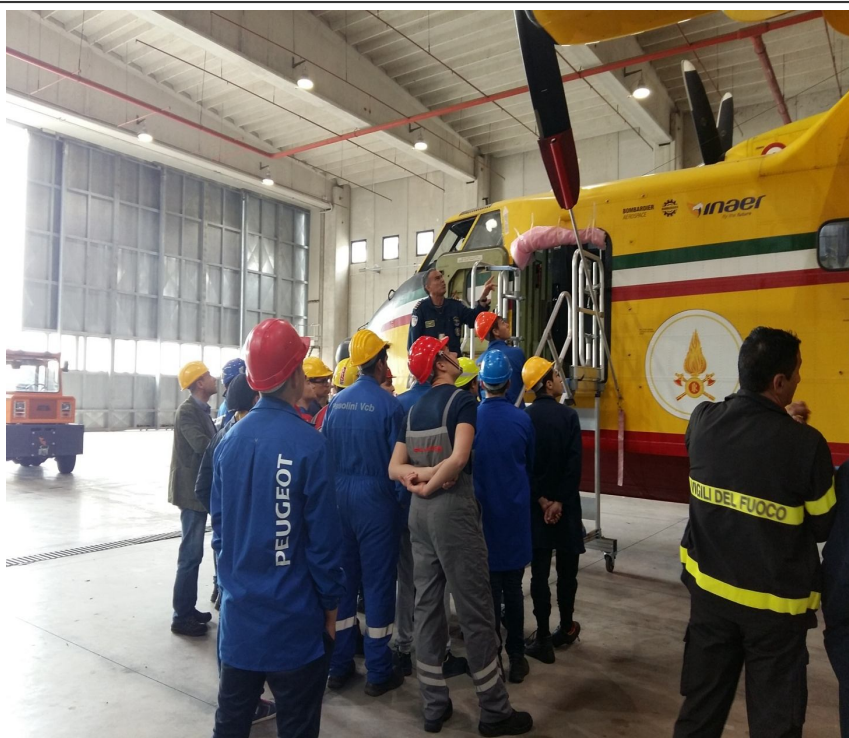
Foto della classe 3M IPSIA, nel corso della visita didattica del 14-04-2016, mentre segue una spiegazione tecnica da parte degli esperti della Base INAER