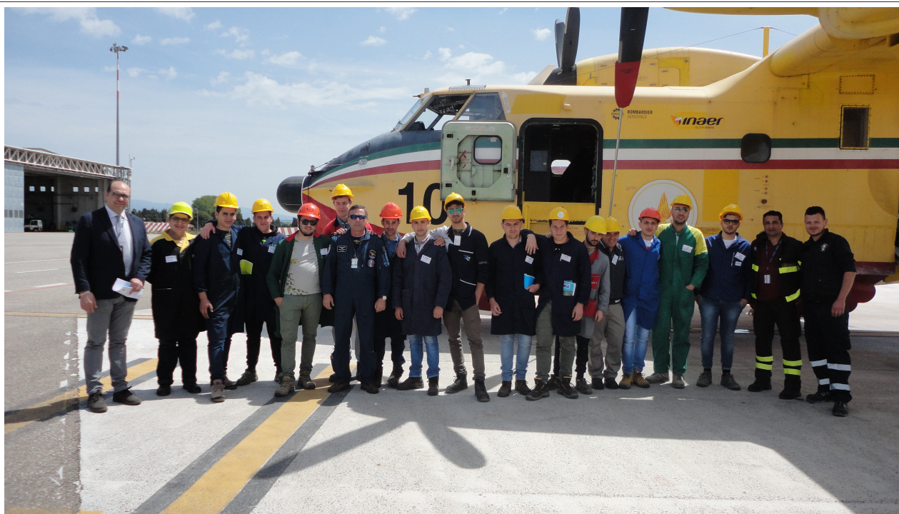
Foto di gruppo classi 4M e 5M IPSIA, affiancate dal personale docente, personale e Responsabile della Base INAER, Responsabile dei Vigili del Fuoco; nel corso della visita didattica del 22-04-2016.