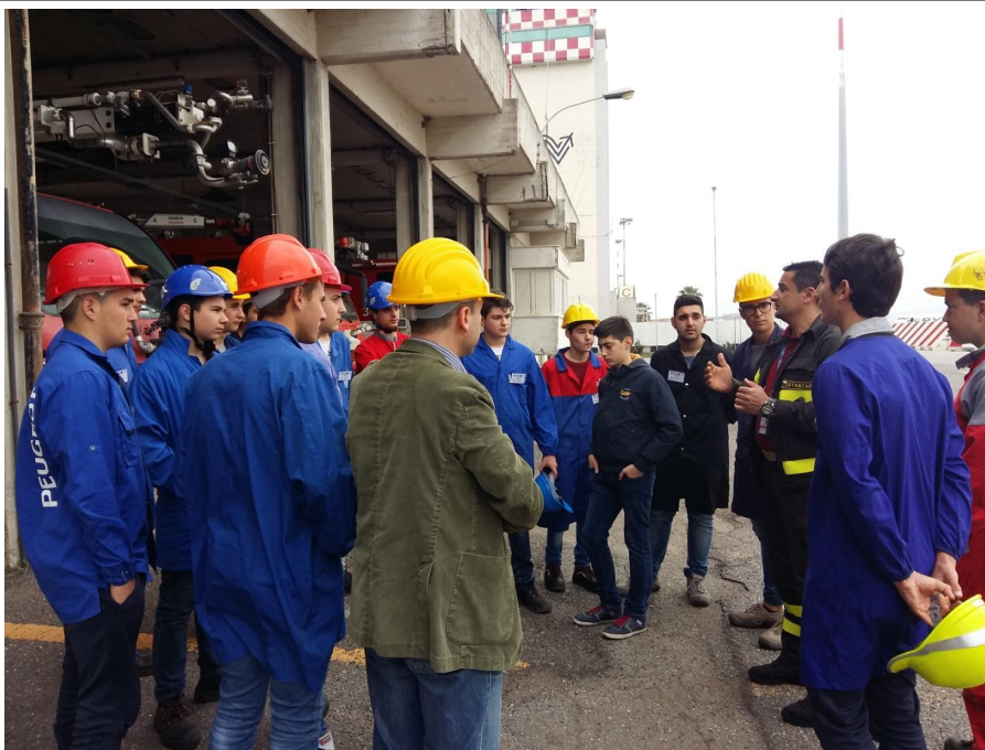
Foto della classe 3M IPSIA nel corso della visita del 14-04-2016, mentre segue una spiegazione tecnica da parte degli esperti della Base dei Vigili del Fuoco.

Si riportano di seguito alcune fotografie che ritraggono momenti delle visite didattiche.