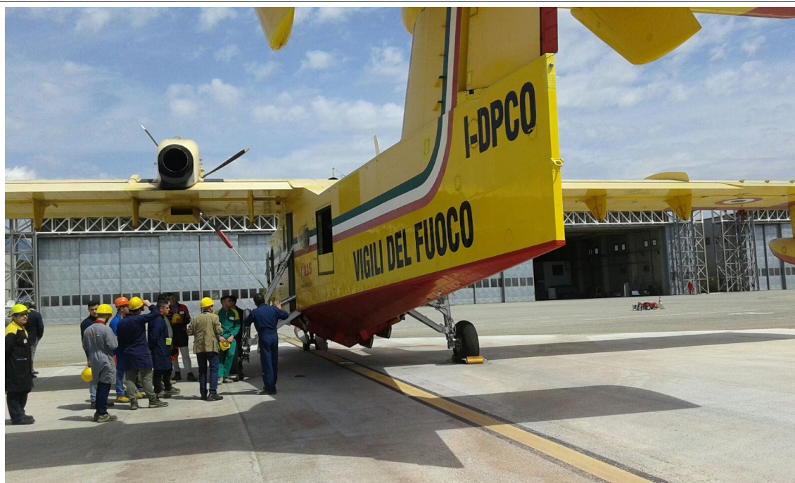
Foto delle classi 4M e 5M IPSIA nel corso della visita didattica del 22-04-2016, mentre seguono una spiegazione tecnica da parte degli esperti della Base INAER.