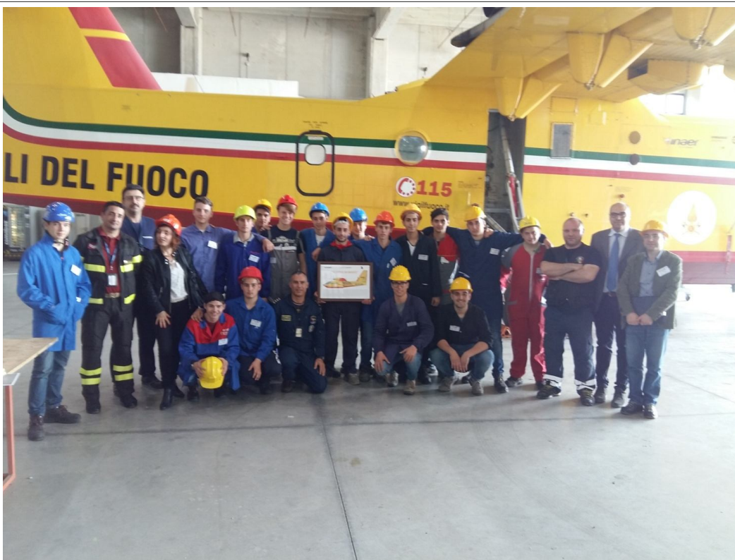
Foto di gruppo della classe 3M IPSIA, durante la consegna del quadro omaggio, affiancata dal personale docente, personale e Responsabile della Base INAER, Responsabile dei Vigili del Fuoco, nel corso della visita didattica del 14-04-2016.