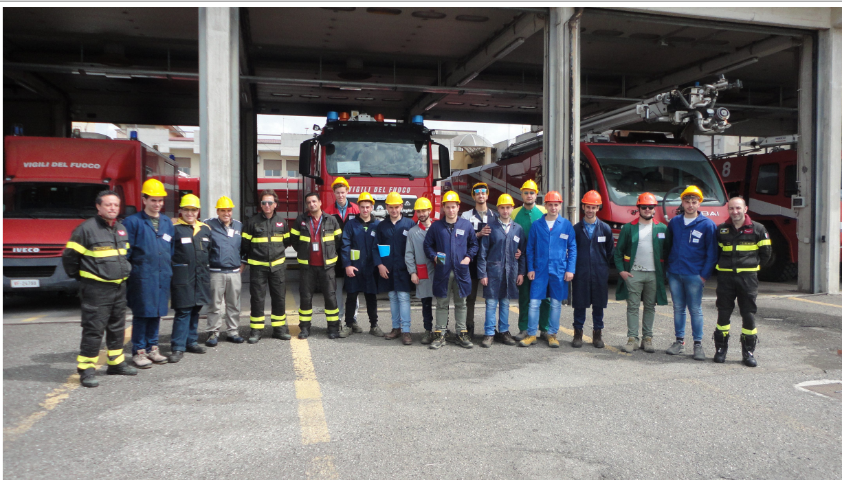
Foto di gruppo delle classi 4M e 5M IPSIA, affiancate da personale docente, personale e Responsabili della Base dei Vigili del Fuoco, nel corso della visita didattica del 22-04-2016.