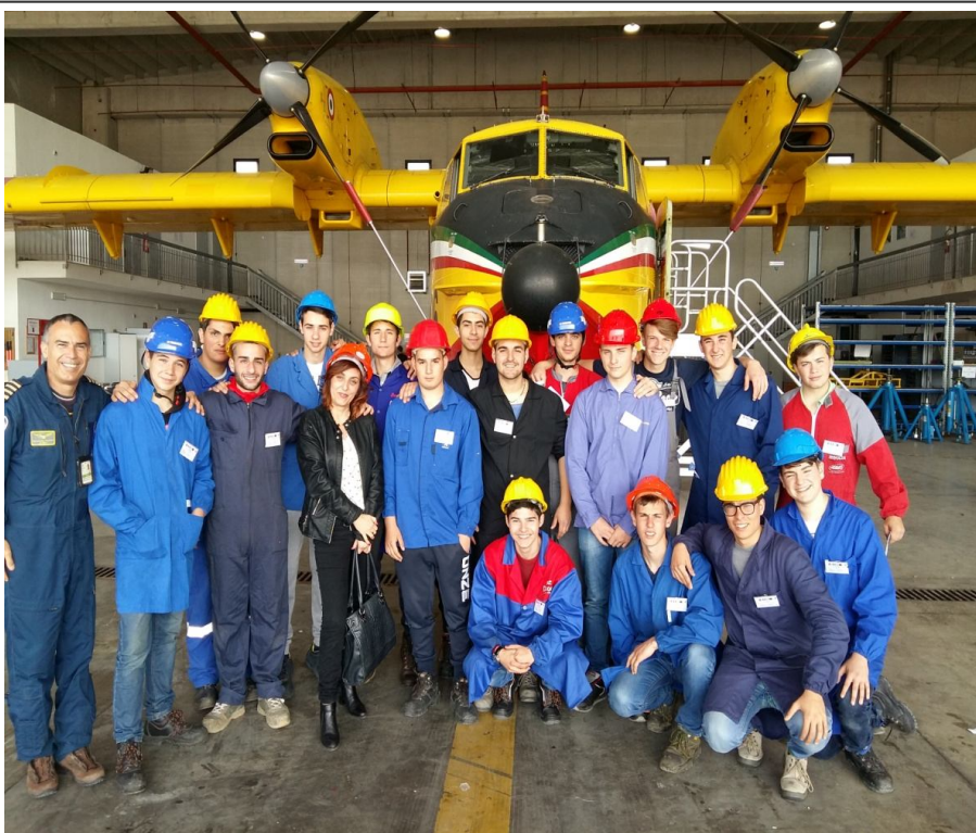
Foto di gruppo della classe 3M IPSIA, affiancata dal personale docente e della Base INAER, nel corso della visita didattica del 14-04-2016.